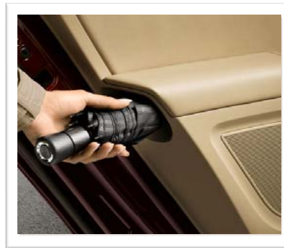
Komfort. Mye standard. Gunstig ekstrautstyr.