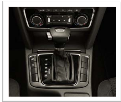
Kan leveres med DSG automatgir