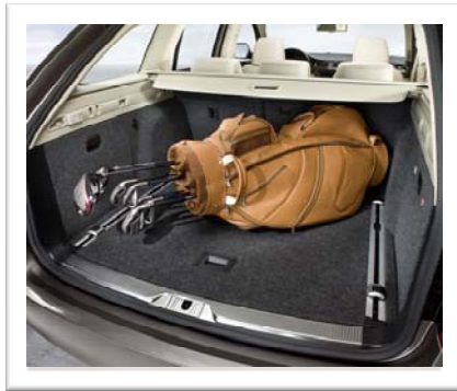
Enormt og fleksibelt bagasjerom 633l / 1865l