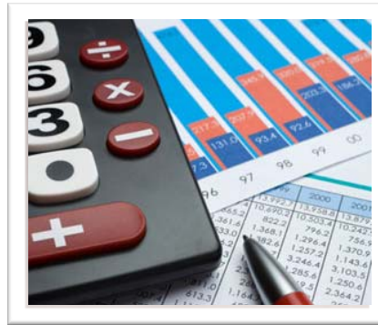
Mye bil for pengene