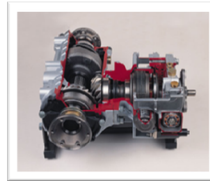
Kan leveres med firehjulstrekk